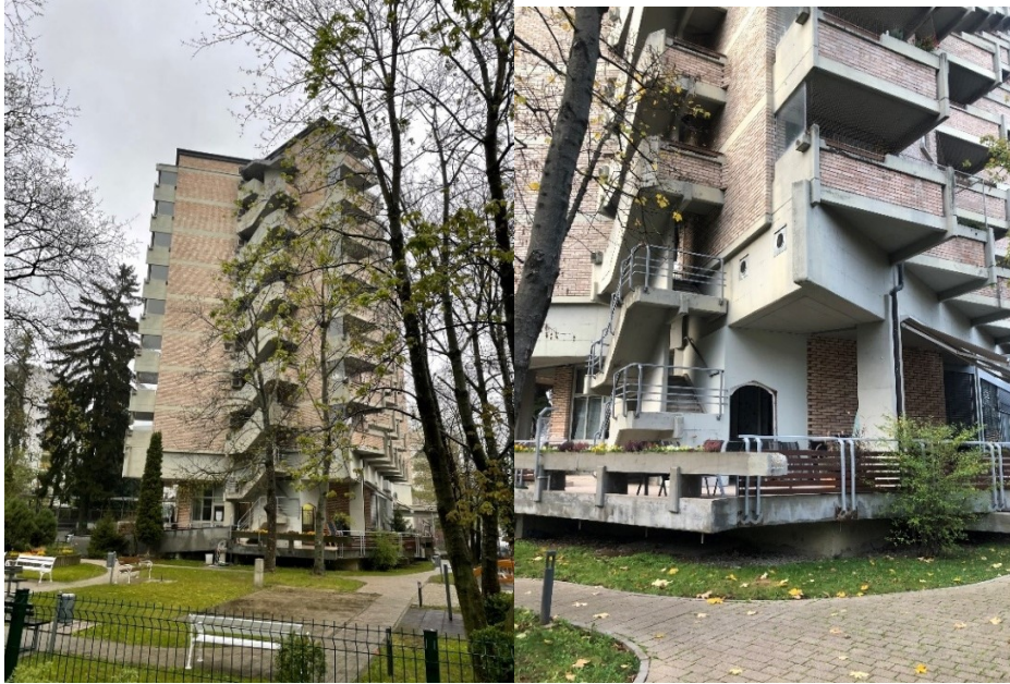
Slike obstoječega stanja