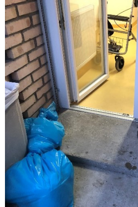
Slike obstoječih podestov

Načrtovani gradbeni poseg obsega dvigalni jašek, ki je temeljen do 1m pod nivojem obstoječega terena ter ima skupno višino (od kote terena) 29,68 m. Vsaka etaža obsega požarno odporni dvigalni jašek in instalacijska jaška, zaščiteno stopnišče ter zunanjo teraso. Tlorisna dimenzija novega objekta je 11,00 x 6,85 m v tipični etaži ter 8,4 x 5,4 m na pritličnem nivoju, ki v prostoru predstavlja podaljšano pritlično teraso. Dolžina dostopne klančine je 15 m in je tlorisno zalomljena ter ima na sredini podest dimenzije 1,5 x 1,2 m,. Na nasprotni strani je še predvideno zunanje stopnišče za dostop s terena na podest v pritličju.