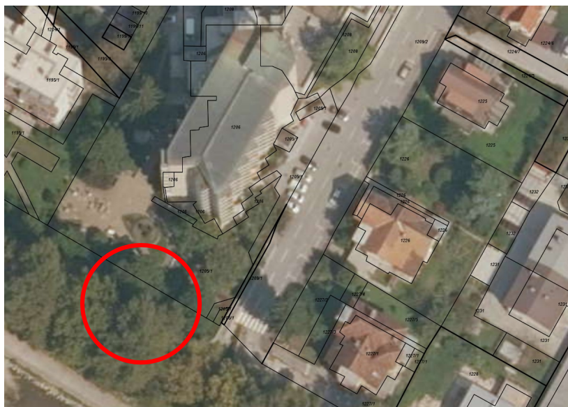
Slika 1 Lokacija obravnavanega območja

Obravnavano območje se nahaja južno od obstoječega kompleksa Doma ob Savinji, med objekti doma in reko Savinjo. Predmet gradnje je rekonstrukcija objekta za potrebe gasilskega dvigala, na parcelnih številkah 1206 in 1205/1, vse v k.o. 1077 Celje, mestna občina Celje.